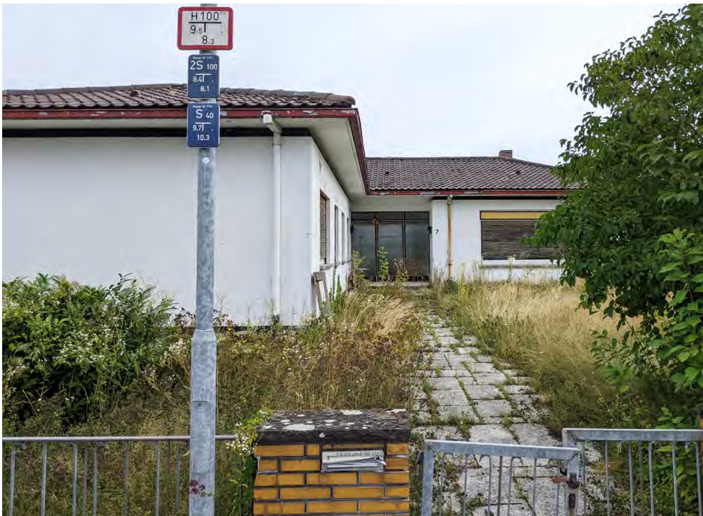
Abb. 5 Leerstehendes Einfamilienhaus in Eggenstein

Eine Anwohnerin, die seit 59 Jahren in der Straße lebt, berichtet, dass fünf der acht Häuser von ein oder zwei älteren Menschen bewohnt würden. Das Haus schräg gegenüber, aus dem Staubsaugergeräusche zu hören sind, bewohne seit Jahrzehnten eine inzwischen hochbetagte Frau alleine. Das Haus hinten rechts stehe seit dem Tod der Bewohner*innen leer (vgl. Abb. 5). Nur im Haus mit dem Wohnmobil davor sei kürzlich eine „junge Familie“ eingezogen. [6] Die Anwohnerin nennt ihre Straße die „Straße der alten Leute.“ [7] Daten aus dem Eggensteiner Grundbuch zur Altersstruktur der Eigentümer*innen der 36 umliegenden Grundstücke bestätigen: Das Durchschnittsalter beträgt 67 Jahre. Nur