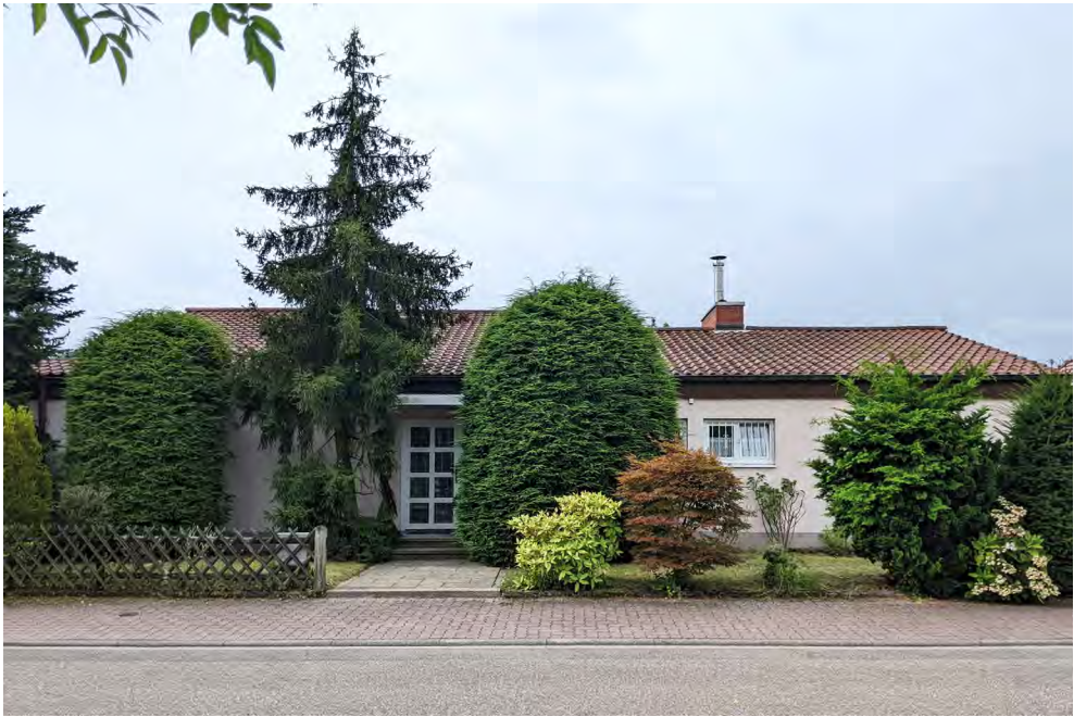
Abb. 2 Das Haus der Familie D. in Eggenstein, Nordfassade

zum Eigenheim in der Schöner Wohnen kenne und es nun, nach deren Abschluss, zum ersten Mal besuchen wolle.