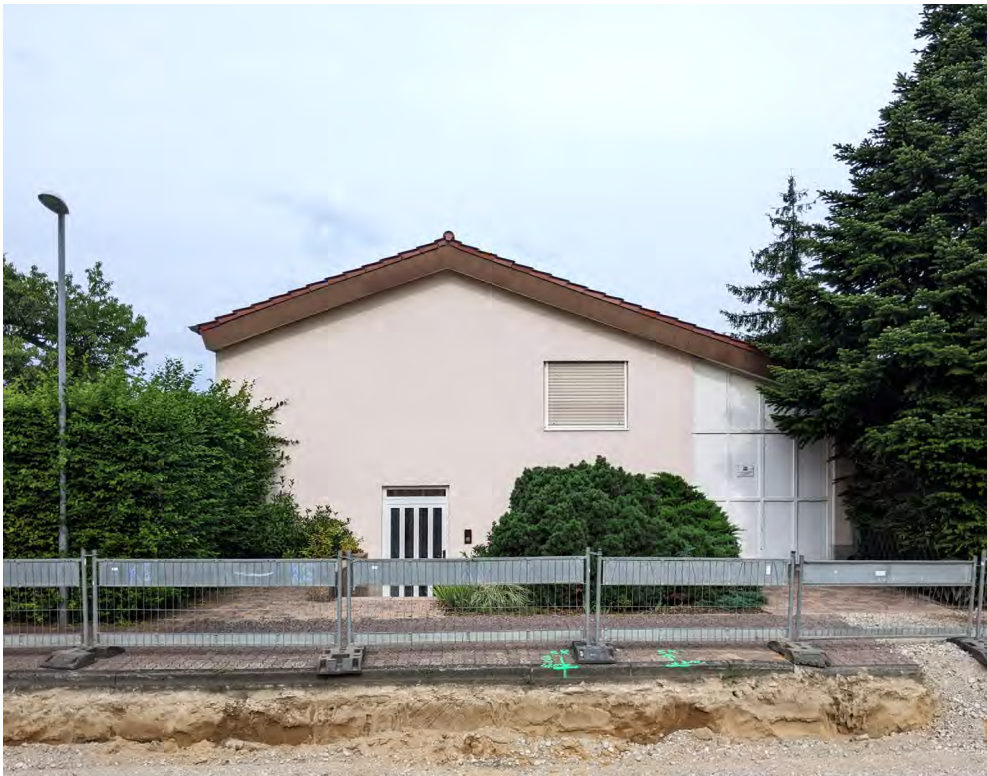
Abb. 8 Das Haus D. in Eggenstein (Ostfassade)

Im selben Jahr, in dem Schöner Wohnen Haus D. präsentierte, fasste die Baunutzungsverordnung (BauNVO) die vielen Einfamilienhausgebieten zugrunde liegende Art der baulichen Nutzung erstmals mit einem bundeseinheitlichen Begriff: „Reine Wohngebiete“, so die Verordnung, „dienen ausschließlich dem Wohnen“ (§ 3 Abs. 1 BauNVO). Auf Einfamilienhäuser abzielend hieß es weiter, im Bebauungsplan könne „festgesetzt werden, daß [...] nur Wohngebäude mit nicht mehr als zwei Wohnungen zulässig sind“ (§ 3 Abs. 4 BauNVO). Während Einrichtungen für kulturelle und soziale Zwecke in diesen Gebieten ausgeschlossen wurden – unabhängig von Lärmemissionen oder Publikumsverkehr –, war der eigene Pkw wesentlicher Bestandteil dieser Form der Stadt und die Garage selbstverständlicher Bestandteil vieler Einfamilienhäuser (vgl. Abb. 8). Entsprechend sind „Stellplätze und Garagen [...] in allen Baugebieten zulässig“ (§ 12 Abs. 1 BauNVO) und bis heute vielerorts Voraussetzung für eine Baugenehmigung – so auch in Eggenstein.[15]