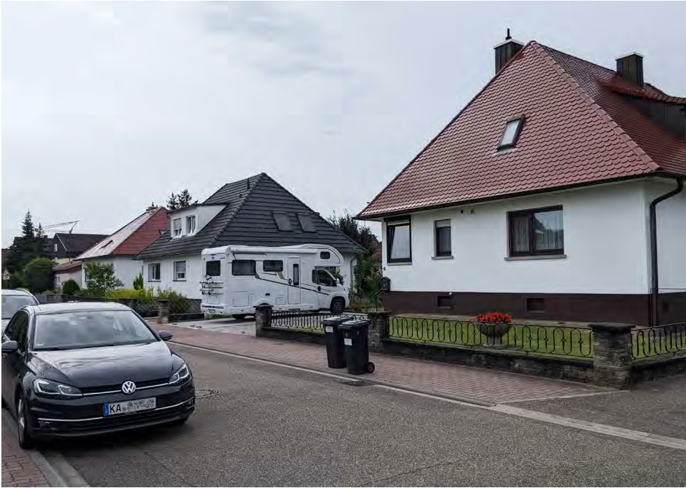
Abb. 7 Einfamilienhäuser in Eggenstein

sowie ein ausreichendes Einkommen verfügten. Ab 1965 gab es einen zweiten Förderweg mit höheren Einkommensgrenzen sowie weitere Fördermaßnahmen (siehe dazu ausführlich Engelke 2025: 139 ff.), etwa Zuschüsse zu Bausparverträgen oder der als „Häuslebauerparagraf“ bekannte § 7b des Einkommensteuergesetzes (EStG), der es erlaubte, Teile der Herstellungskosten eines Eigenheims von der Einkommenssteuer abzusetzen (Schulz 1994: 335) – wovon nur Menschen mit entsprechend hohem Einkommen profitierten. Trotz anderslautender politischer Absichtserklärungen wurde also mittels des sozialen Wohnungsbaus privates Wohneigentum von Besserverdienenden gefördert (Keil 1996: 48). Der oft beschworene Traum vom Eigenheim ließ sich nur mit entsprechendem Einkommen oder Vermögen realisieren.