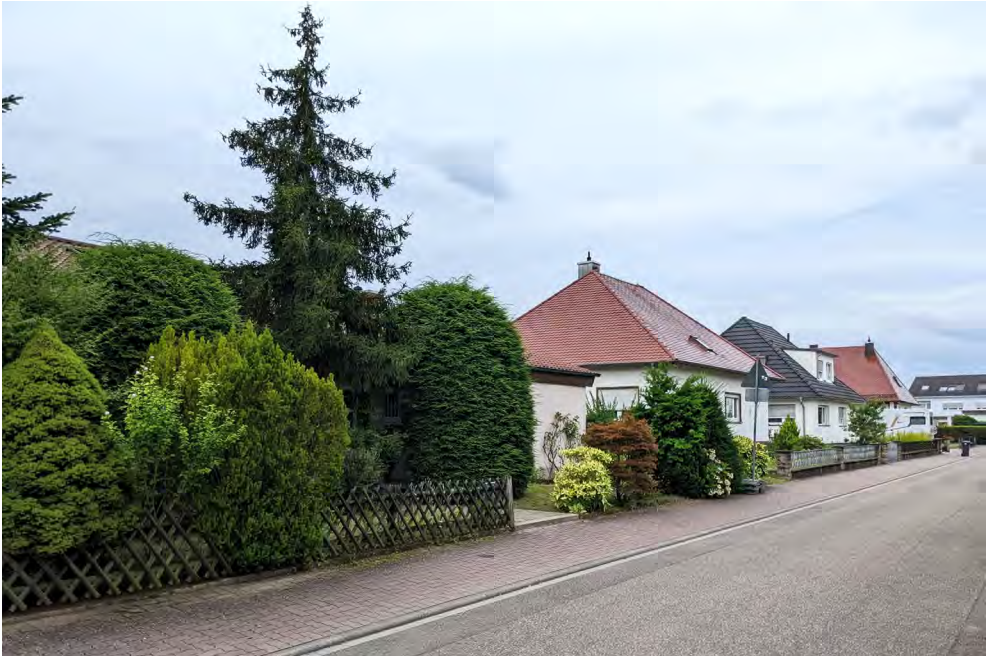
Abb. 1 Einfamilienhäuser in Eggenstein. Links hinter den Büschen: Haus D.

Diskriminierungen entlang intersektional verschränkter Kategorien wie Klasse, Alter, Gender und race führen hier zu Ausgrenzungen, die Paul Preciado (2018: 7) mit dem Begriff „Hypersegregation“ beschreibt.