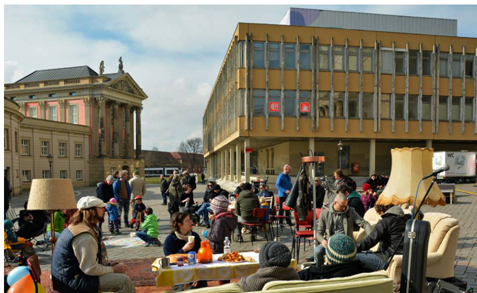
Abb. 2 Aktion „Platz nehmen“ des Bündnis Stadtmitte für alle am 12.03.2018

Mit zahlreichen Veranstaltungen und kreativen Protestformen wie „Platz nehmen“ auf dem Alten Markt und einem „24-Stunden-Staffellauf“ um die Fachhochschule haben diese Initiativen ihre Forderung direkt in die Stadt getragen (vgl. Abb. 2). Diese Aktionen entfalteten eine starke diskursive und physische Mobilisierungskraft: im Laufe weniger Monate haben mehrere Tausend Menschen – oft zum ersten Mal – den Alten Markt als signifikanten Ort im Zentrum wahrgenommen und ihn sich angeeignet. Mit dem Bespielen des Platzes durch regelmäßige Versammlungen, dem Aufstellen von Sofas und Sitzkissen, Infoständen, Siebdruckwerkstätten, Spielen und Konzerten und einem Protestcamp wurde diese Leerstelle mit Leben gefüllt. Aus der Aneignungspraxis vieler oft bislang nicht politisierter Menschen entwickelten sich gemeinsame Visionen einer alternativen Stadtmitte. Vor allem die Fachhochschule wurde zu einer Projektionsfläche für Nutzungswünsche all jener, die sich mit der Verwertung und ‚Preußifizierung‘ der Stadt unwohl fühlen. Die Initiative „Potsdamer Mitte Neu Denken“ hat in zahlreichen Diskussionen und Veranstaltungen nicht nur die denkmal- und städtebauliche Signifikanz der Fachhochschule in den lokalen Diskurs eingebracht sondern auch das Umnutzungspotential dieses Gebäudes betont. Die Sanierung, so die Forderung an die Stadt, ist möglich und kostengünstiger als der Abriss und ermöglicht die Errichtung eines „Haus der Stadtgesellschaft“, das