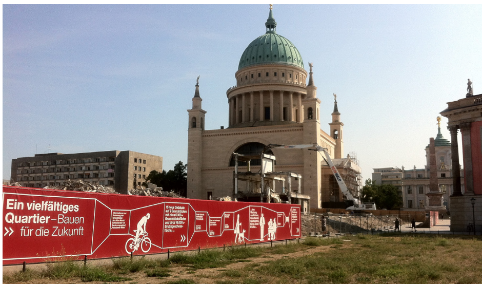
Abb. 3 Das abgerissene Gebäude der FH am Alten Markt

Kleine Erfolge verdeutlichen den gewachsenen Widerstand gegen das lokal noch hegemoniale Projekt der Rekonstruktion. Zum ersten Mal seit über zehn Jahren haben Potsdamer_innen wieder einen konkreten Anspruch auf die Stadtmitte formuliert, der sich gegen die Pfadabhängigkeit der bisherigen Entscheidungen stemmt. Diese Gegendiskurse zeigen auf, wer in diesem großartig restaurierten Potsdam keinen Platz haben wird. Sie verteidigen hier