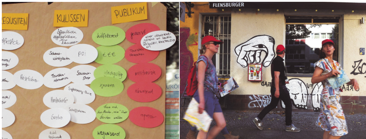
Abb. 5 und Abb. 6 Ergebnisse Open-Air-Workshop zur Ausgestaltung der performativen Interventionen und praktisches Umset- zungsbeispiel

Reaktionen wollen wir wie hervorrufen? Welche Sinnzusammenhänge gilt es auf den Kopf zu stellen?