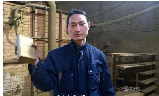
Abb. 3 Project Dust

Vorgehensweise jedoch auch eine Ironie, die zur Problematisierung und Bekämpfung anthropogener Umweltzerstörung beiträgt. Im Gegensatz zu Verfechter*innen der These des „guten Anthropozäns“ (Bennett et al. 2016), die auf technologiebasierte Innovationen und Entwicklungen zur ‚Behebung‘ des Anthropozäns setzen, greift Nut Brother zu einfachen Mitteln wie dem Staubsauger, um Luftverschmutzung zu dokumentieren. Nut Brother scheint dem fortschrittsorientierten Rahmen des ‚guten‘ Anthropozäns ein wenig Wind aus den Segeln zu saugen beziehungsweise die Hoffnung auf Besserung und gegebenenfalls auch Bewältigung anthropogen verursachter Umweltkatastrophen etwas zu dämpfen.