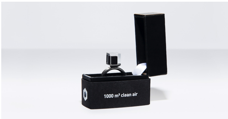
Abb. 4 „Smog-Free“-Ring (Quelle: Studio Roosegaarde[14])

Weiterhin präsentiert Roosegaarde sein Werk als lokale „Lösung für das Problem anthropogener Luftverschmutzung“ und es wird auch in Zeitschriften (Schlick 2019) und in Architektur- und Design-Diskursen als Lösungsbringer beschrieben.[15] Hier scheint Roosegaardes (implizite) Sympathie mit dem ‚guten‘ Anthropozän durch. Saubere Luft wird als erstrebenswertes Gut positioniert und mithilfe der ‚richtigen‘ technologischen Innovationen aus