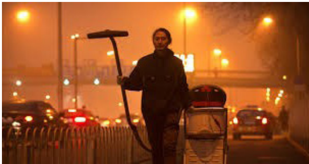
Abb. 2 Project Dust