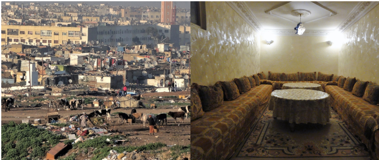
Abb. 2 Gegen- sätzliche Außen- und Innenansichten der Wohnbebauung in Er- Rhamna, Casablanca (Quellen: eigene Fotos, Februar und März 2017)

Im Fall von Er-Rhamna wird dies auch dadurch verstärkt, dass die Siedlung von innen nach außen gewachsen ist. Das heißt, ältere und über die Jahre ausgebaute, verstetigte und verschönerte Häuser befinden sich vor allem im Inneren der Siedlung, während jüngere, oft prekärer aussehende Häuser überproportional oft an den Rändern der Siedlung liegen und somit stärker von außen wahrgenommen werden können.